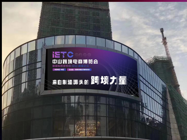
楼盘户外大屏广告